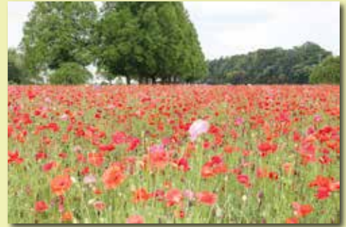
あけぼの山農業公園のポピー畑 5月28日撮影